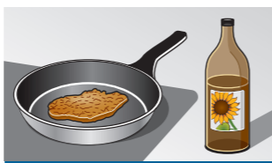
4 Medium - hoog

Het bakken van vis en dikke gerechten, bijv. gehaktballen en worstjes.