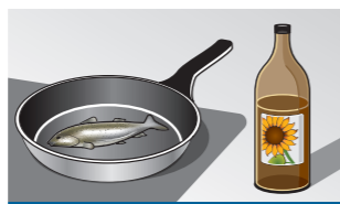
3 Medium - laag

Bakken zonder gebruik van olijfolie, boter of margarine, bijv. omeletten