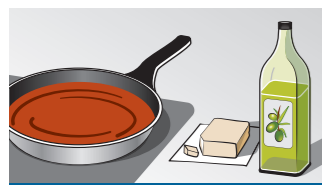
1 Erg laag

Extra informatie kan worden gevonden in de uitgebreide gebruikershandleiding voor de kookplaat, in het hoofdstuk "Braadsensor". U dient dit zorgvuldig te lezen. Het receptenboekje kunt u op onze website met vermelding van het productnummer (E-nr.) downloaden.